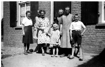
fig. 2. De familie Borgman, met twee van de dames die tijdens de hongervinter met een handkar vanuit Haarlem bij hen voedsel waren komen halen.

In de Achterhoek hebben burgers niet echt honger geleden, daar zorgden de boeren wel voor, maar diegenen die uit het westen kwamen, kwamen echt vanwege