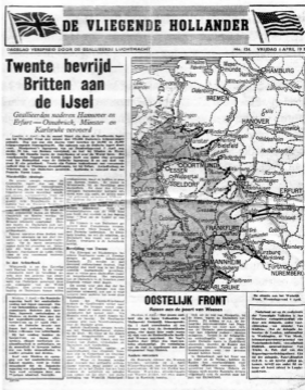
fig. 3. Vluchtschrift geda- teerd 6 april 1945 - dus Vorden was al bevrijd - op het einde van de oorlog verspreid vanuit Engeland

inderdaad plofte er een sigaarvormig, blank voorwerp neer, een paar honderd meter van ons vandaan in het weiland van Opa Beumer. Gelukkig was het geen bom, maar een benzine-reservetank, die de vliegtuigen voor extra brandstof aan de vleugels meenamen om hun vliegbereik te vergroten.