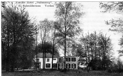
fig. 2. Het Familie-hotel Buitenzorg, gezien vanaf de kant van Vorden. Rechts, achter de bomen, het boerderijtje van de familie Stokkink. (Ansichtkaart uit de jaren '20)

worden, want er kwam het hoofdkwartier van de Wehrmacht in. Ook de andere villa's: het Verendaal (wordt nu Pax genoemd), het Hoge Zand en het Hoekendaal moesten door de bewoners worden verlaten. Het telefooncentrum kwam in Buitenzorg, de keuken in Hoekendaal, de generaals en luitenants in het Hoge Zand en de rest in Verendaal.