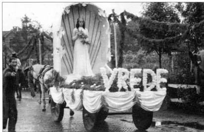
fig. 1. Een van de wagens die deelnam aan de allegorische optocht direct na de Bevrijding. Links op de foto is Derk Jansen te herkennen.

Het was een zeer beroerde tijd en ik heb vele slachtoffers zien vallen. We werden vernederd en misbruikt en waren volkomen machteloos.