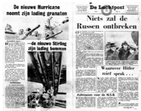
fig. 3. Een illegale krant, als vluchtschrift vanuit Engeland verspreid door de RAF.