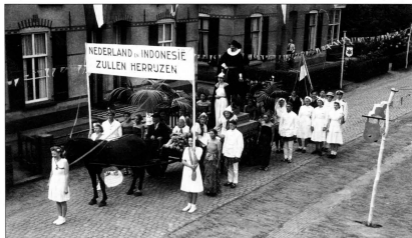
fig. 4. Een van de wagens, met entourage, die tijdens de bevrijdingsoptocht in Vorden meereed/meeliep).

Met mijn moeder achter op de motorfiets van Van der Peijl gingen ze naar Ede.'s Avonds laat kwamen ze weer terug. Het was geen best nieuws waar ze mee terug