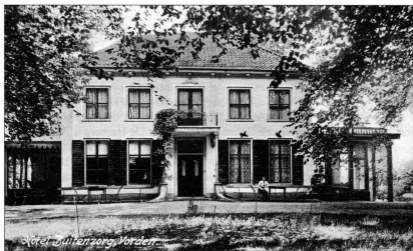
fig. 1. Buitenzorg in de jaren '20, toen het nog als hotel werd geëxploiteerd. (ansichtkaart)

werk voor mij als afgekeurde werkmán. Ga maar naar hoenderpark 'Buitenzorg', want daar hebben ze iemand nodig om eieren te rapen, deelde hij mij mee.